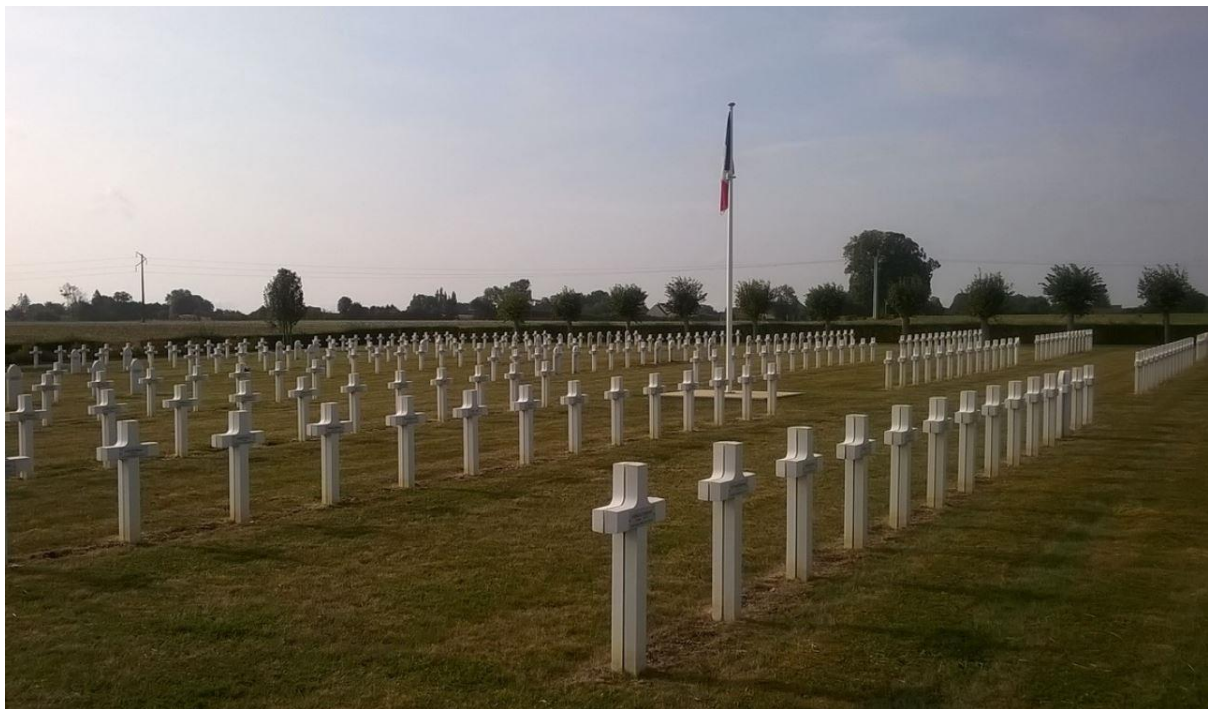
Nécropole Nationale, Méry-la-Bataille, Oise.