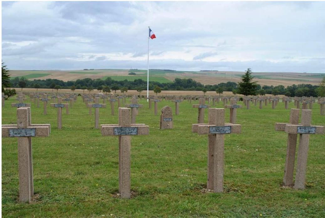
Possibly buried Somme War Cemetery