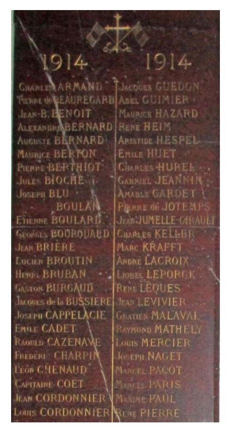
Memorial Plaque Church Notre Dame des Champs, Paris