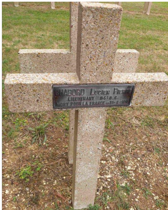
NECROPOLIE NATIONALE LE BOIS DES OUVRAGES, CLERY-SUR-SOMME, SOMME, GRAVE 805

Memorial: Memorial grave in the Cemetery at Chambéry, Savoie. Remembered on the War Memorial at Bissy, Savoie and on the Memorial Plaque in the Church at Bray-sur-Somme. Also remembered on the French Consul Memorial Plaque in London.