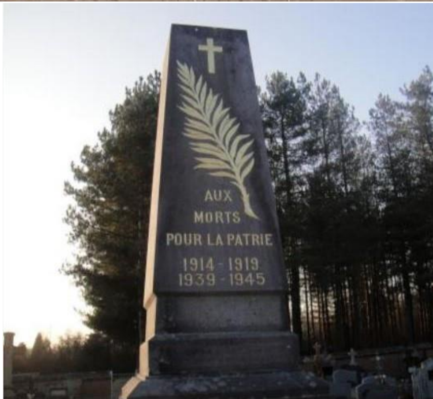
Monument at Chaumont-Sur-Tharone