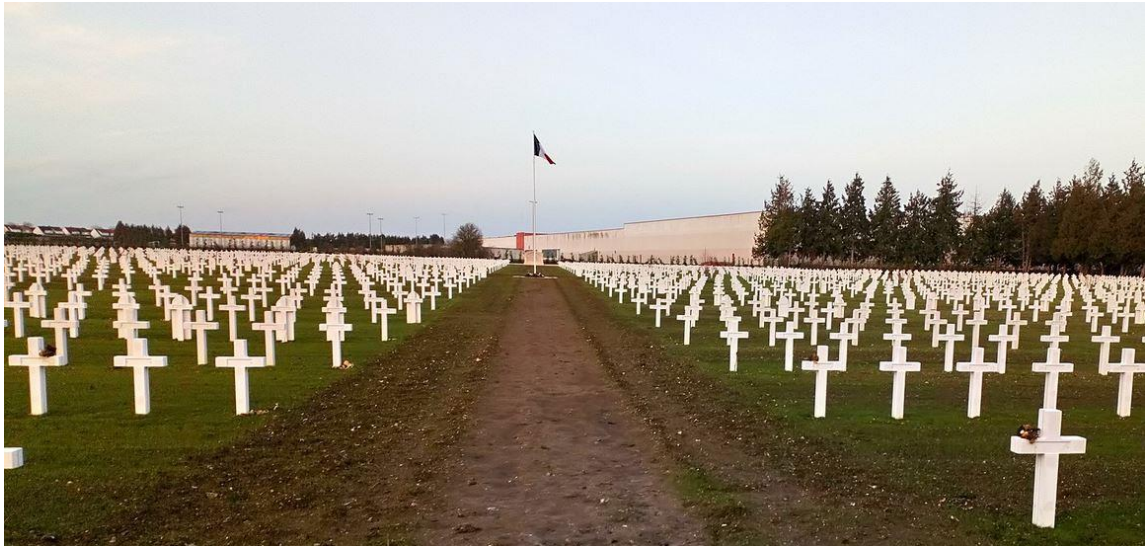
Grave located Necropole Nationale Montdidier