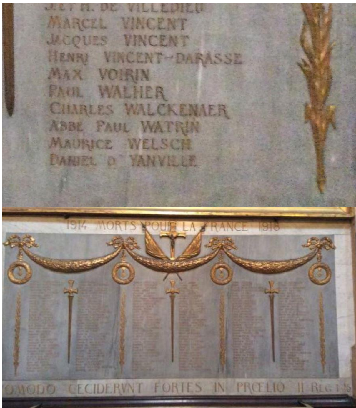
REMEMBERED ON THE COMMEMORATIVE PLAQUE ST THOMAS AQUIN PARIS