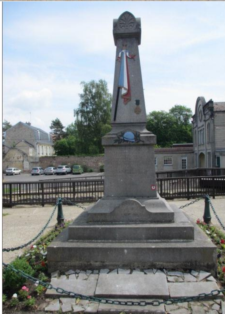
REMEMBERED ON THE MEMORIAL AT CIRES-LES-MELLO