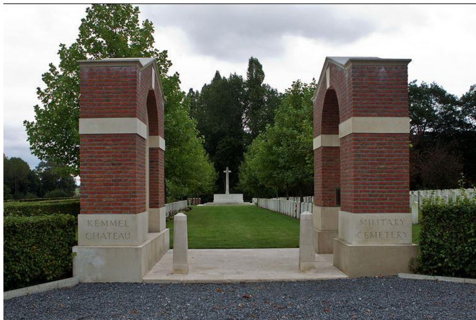
The Kemmel Chateau Military Cemetery