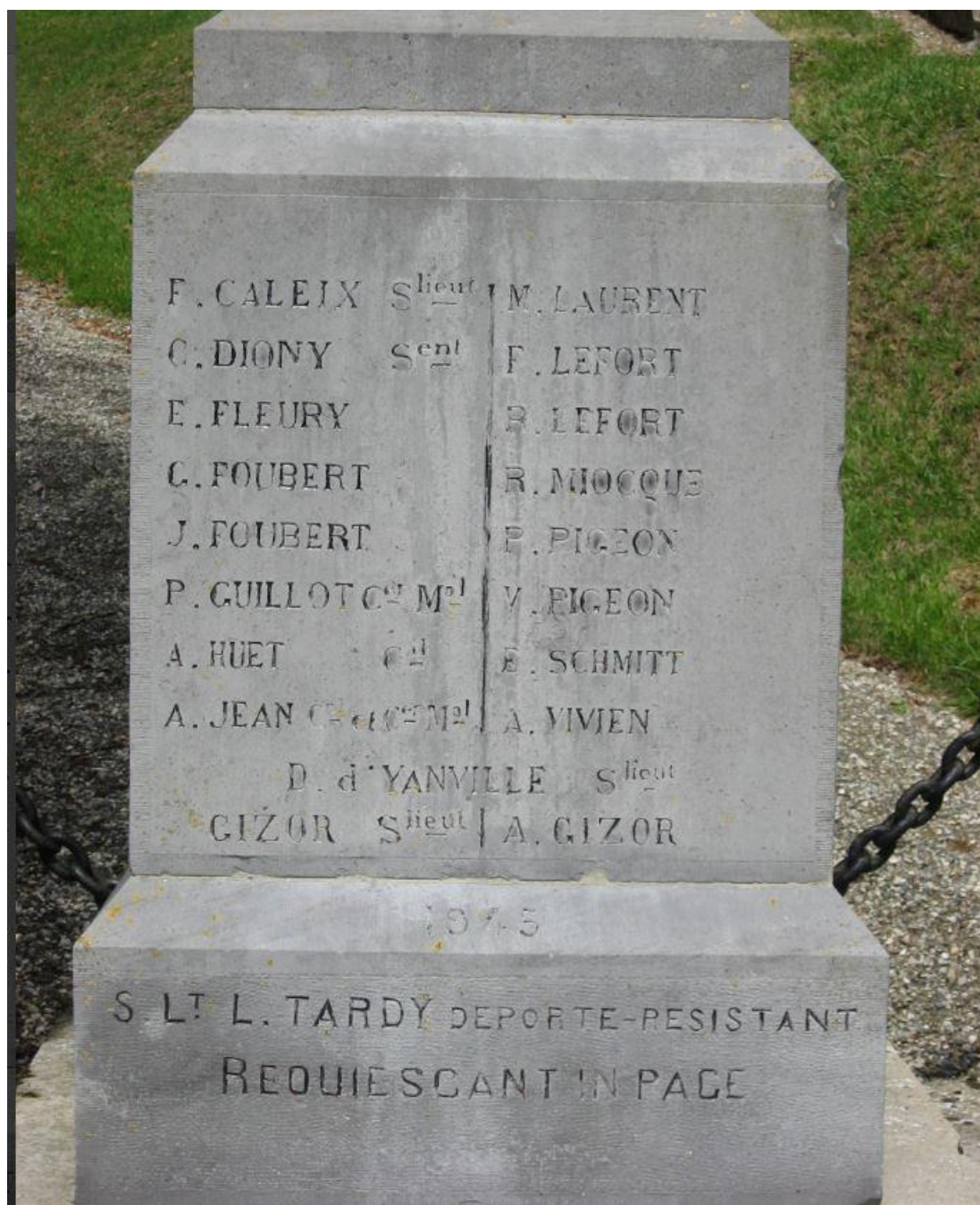
REMEMBERED ON THE WAR MEMORIAL AT GRANGUES