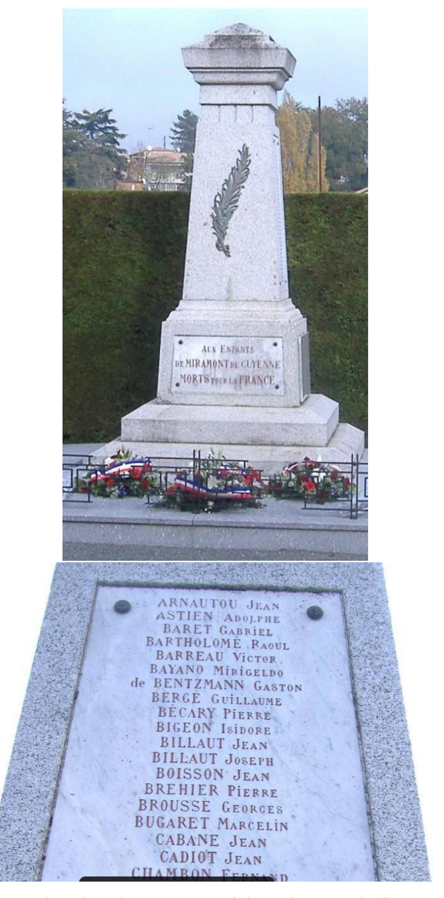
Remembered on the War Memorial at Miramont-de-Guyenne