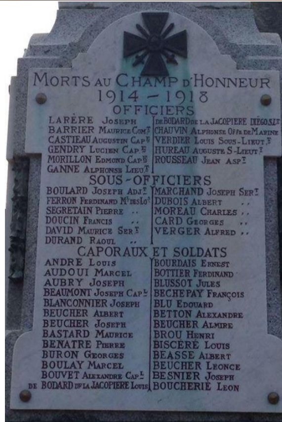
War Memorial at Craon, Mayenne