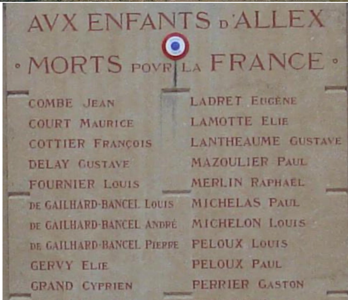
Remembered on the War Memorial in the Cemetery at Alex, Drome - Buried in the Family Grave at Alex, Drome