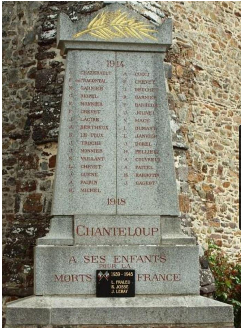
Remembered on the War Memorial at Chanteloup