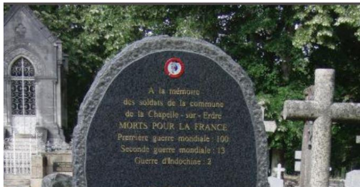
Memorial in the Church at La Chapelle-sur-Erdre