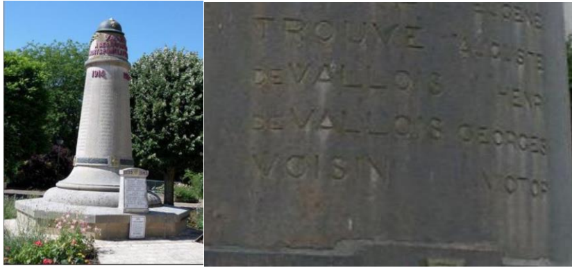
Remembered on the War Memorial at Vaan, Sarth