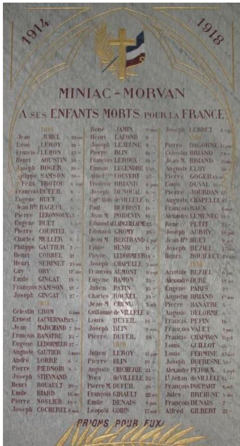
Remembered on Commemorative Plaque within the Church at Miniac-Morvan