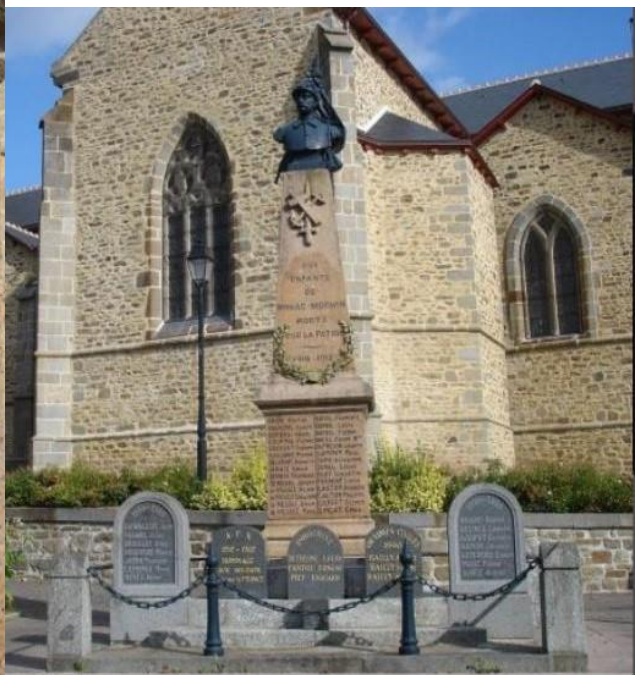
Remembered on the War Memorial at Miniac-Morvan