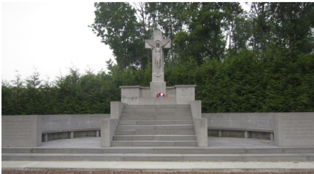
The War Memorial at Oppy, Pas-de-Calais