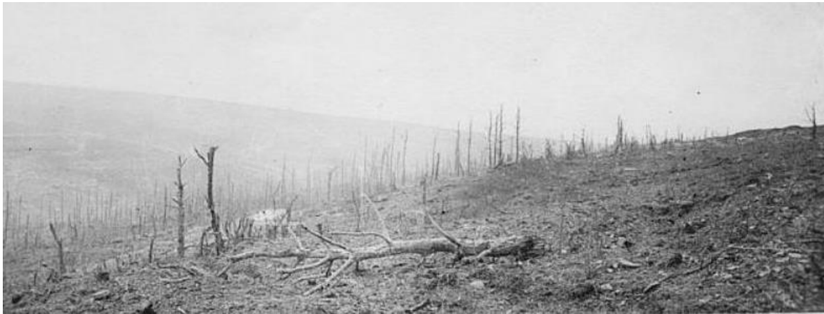
PHOTOGRAPHS OF COTE DE FROIDETERRE THIAUMONT & RAVIN DES VIGNES NEAR VERDUN

Memorial: Remembered on the Commemorative plaque at the Hotel de Ville in Romans-sur-Isere and on the Commemorative plaque at Fleury-devent-Douaumont.