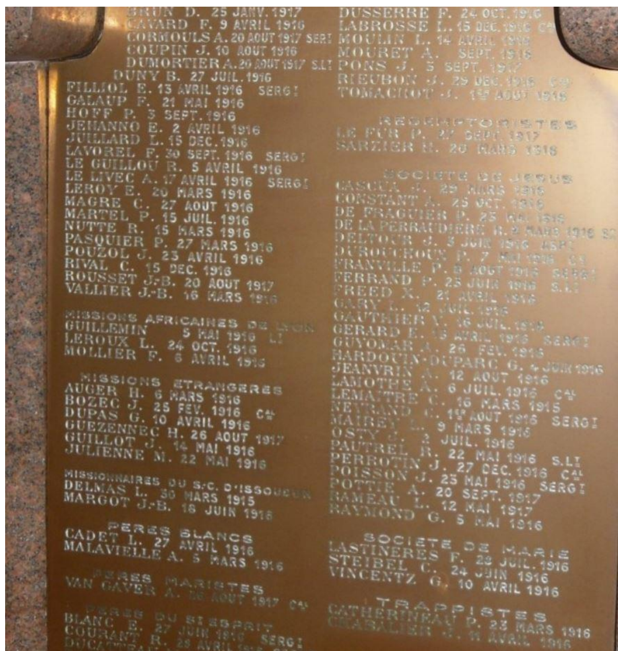
REMEMBERED ON THE COMMEMORATIVE PLAQUE AT FLEURY-DEVENT- DOUAUMONT.