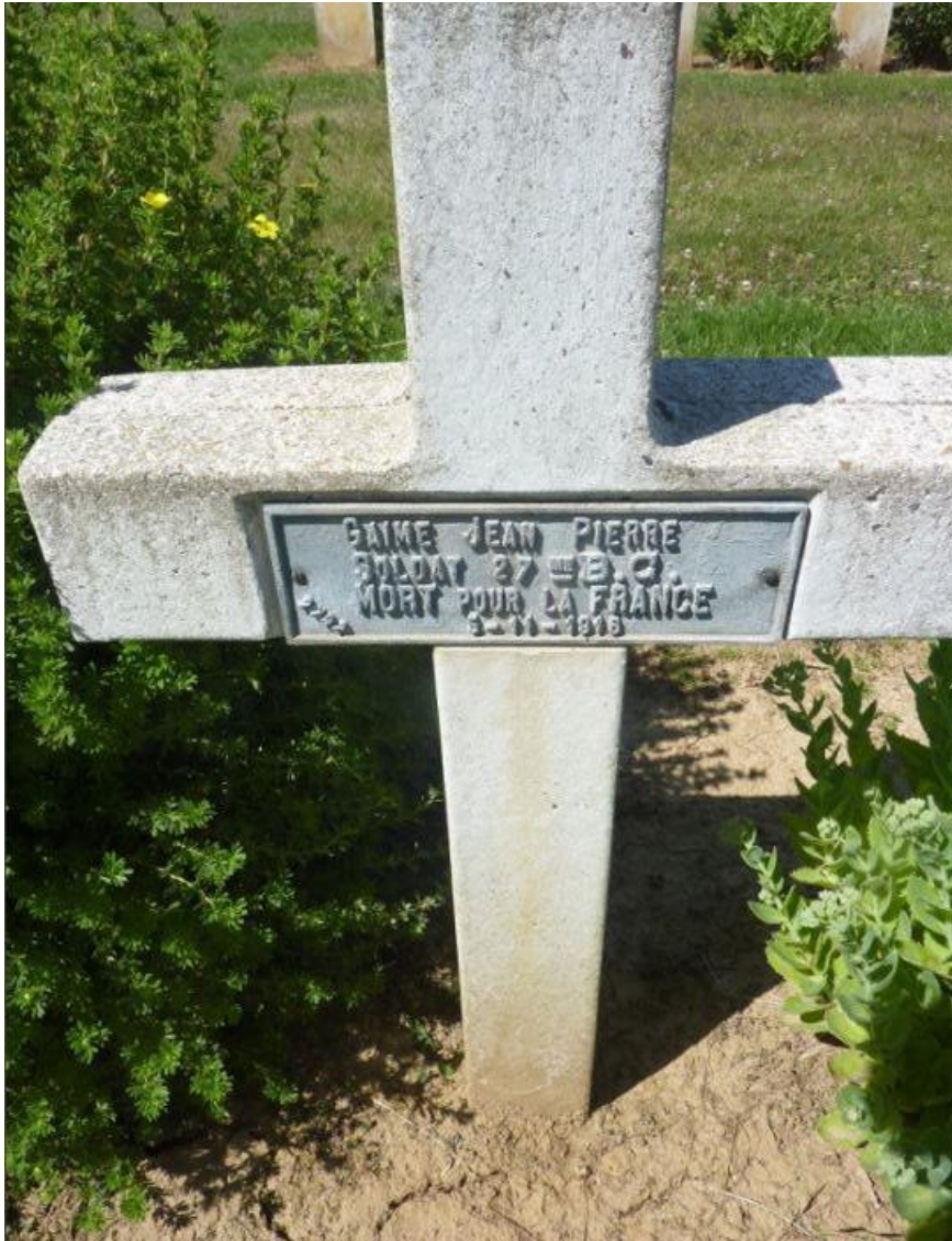
NECROPOLIE NATIONALE RANCOURT, SOMME - GRAVE NO 2792