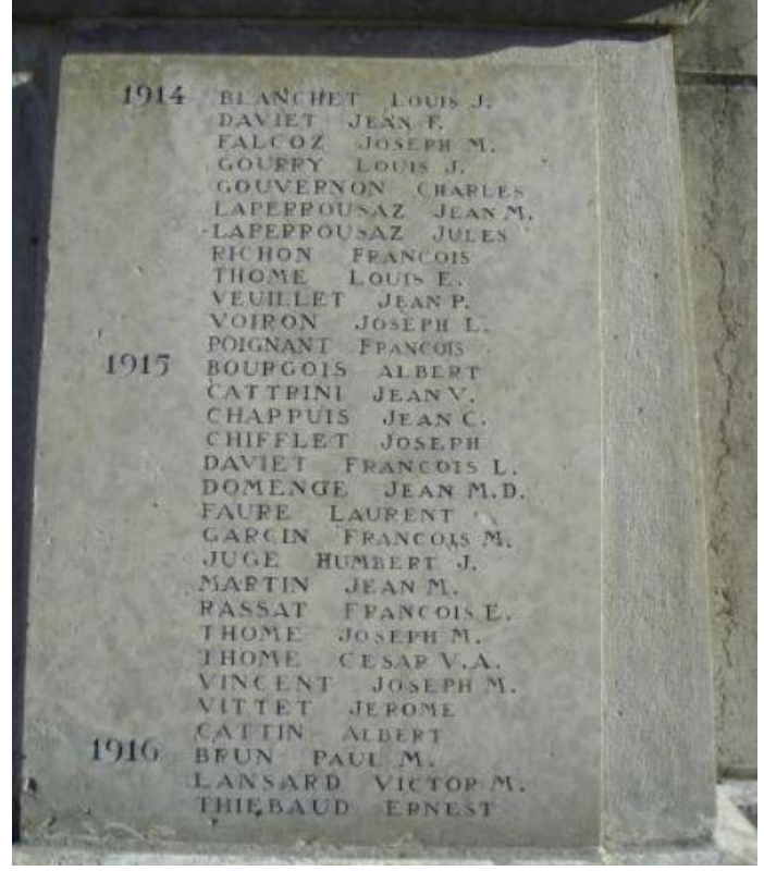
War Memorial Alby-sur-Chéran Haute-Savoie