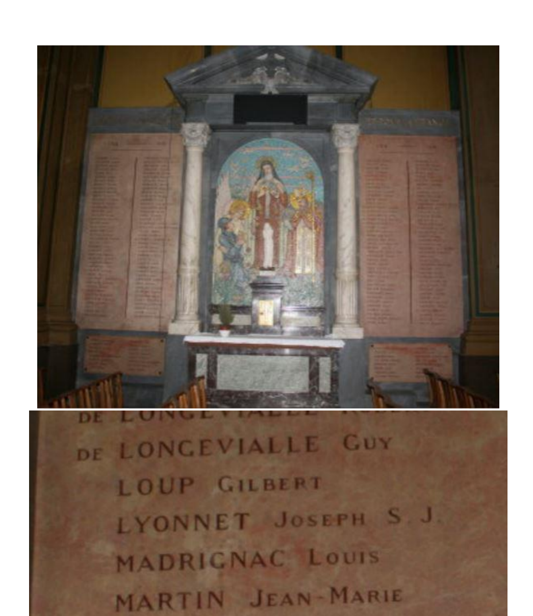
REMEMBERED ON THE MEMORIAL IN THE CHURCH SAINT FRANCOIS DE SALE, LYON, RHONE