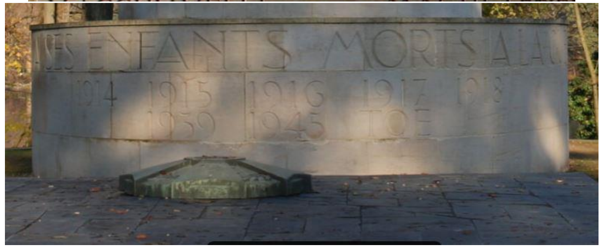
REMEMBERED ON THE WAR MEMORIAL AT LYON, RHONE