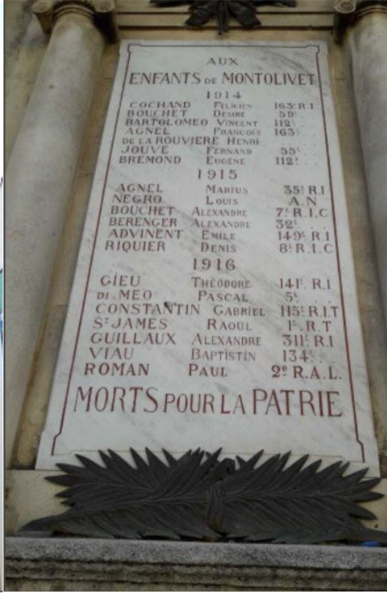
REMEMBERED ON THE WAR MEMORIAL IN THE CHURCH OF LE FORTUNE DE SAINT MONT OLIVET IN MARSEILLE (ABOVE) & THE WAR MEMORIAL PLAQUE IN THE BASILICA OF THE SACRED HEART OF JESUS IN MARSEILLE (BELOW)