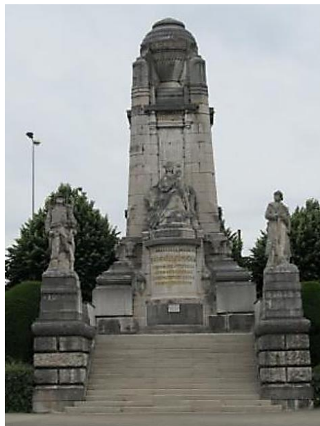
Remembered on the War Memorial at Besancon, Doubs