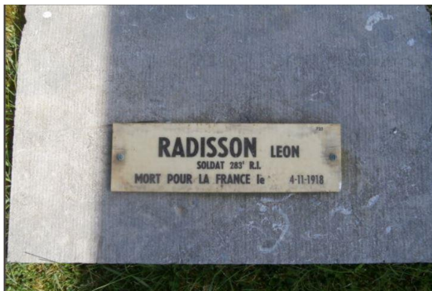
NECROPOLIE NATIONALE DE LE SOURD GRAVE NO 725

Memorial: Remembered on the War Memorial at Caluire-et-Cuire, Rhone