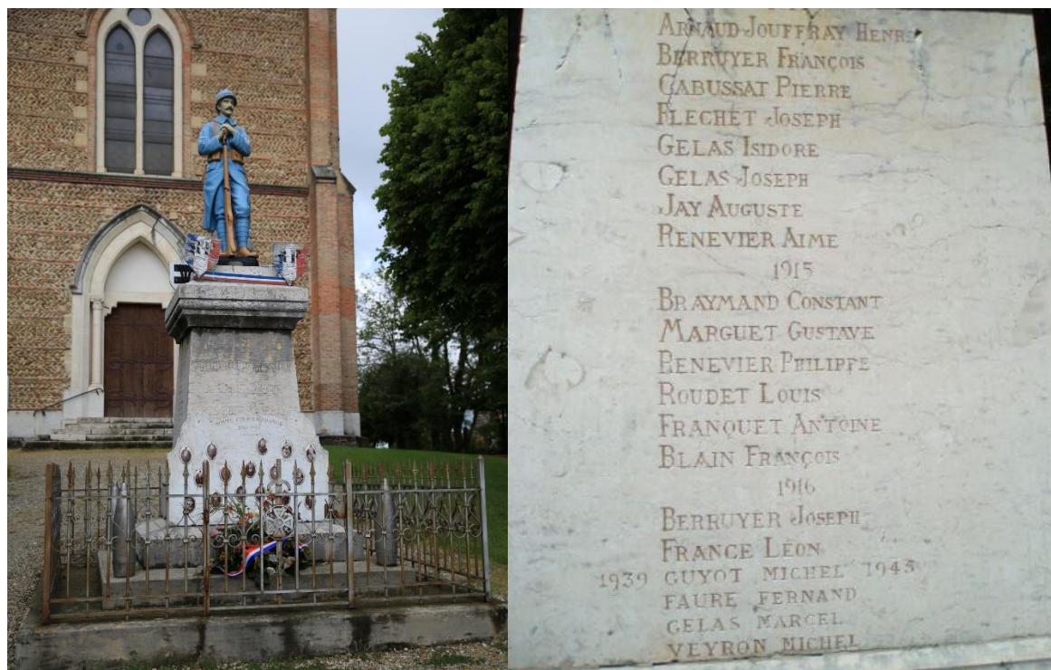
REMEMBERED ON THE WAR MEMORIAL AT SAINT PIERRE DE BRESSIUX, ISERE