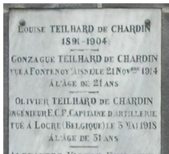
Teilhard de Chardin Family Grave Cimetiere des Carmes de Clermont-Ferrand, Puy-de-Dome