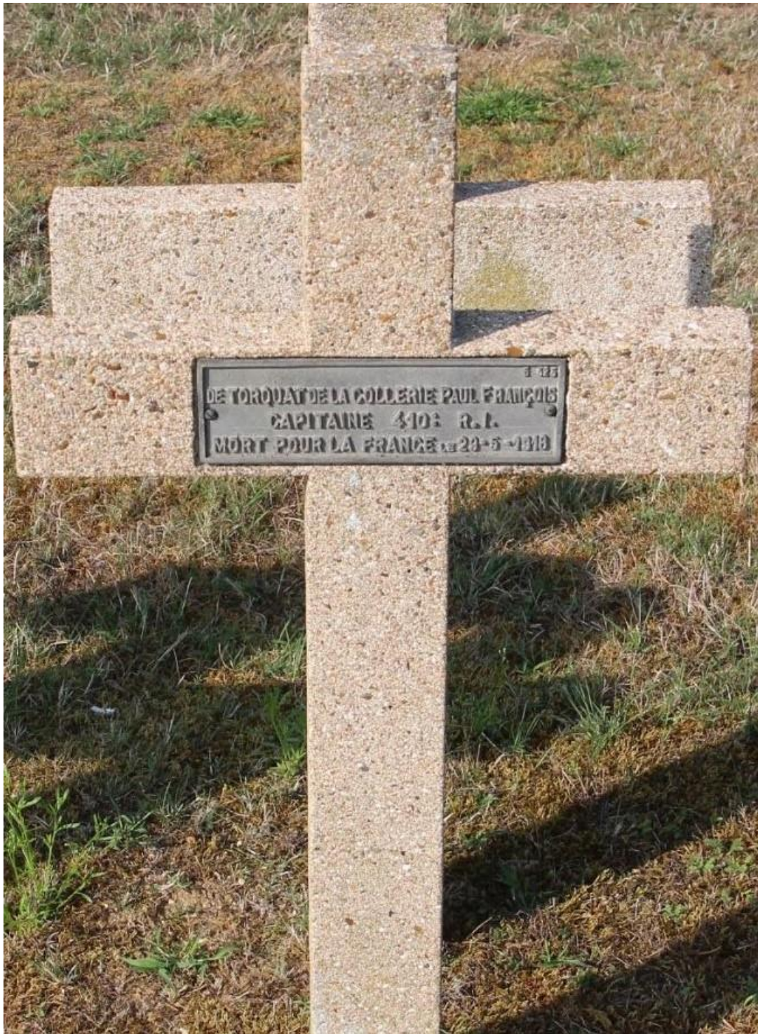
Grave E.325 Necropole Nationale Le Bois Roger, Ambleny, Ainse