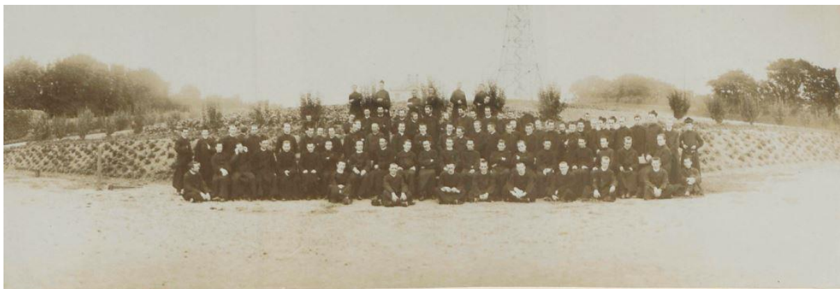
Scolasticat de Jersey - Les Philosophes de 1902-1903.